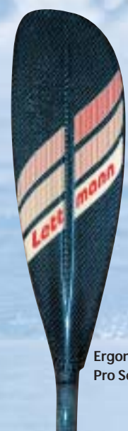
Ergonom Pro Sea LCS 70