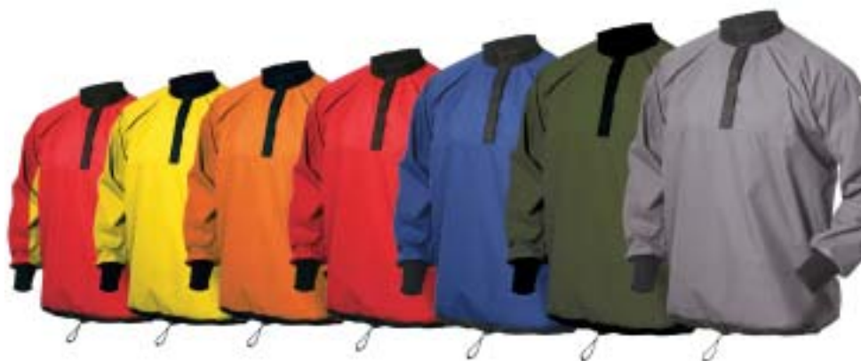
E NKE (Rot-Gelb = XXS / Gelb = XS / Orange = S / Rot = M / Blau = L / Grün = XL / Grau = XXL)