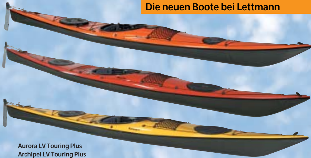
Aurora LV Touring Plus Archipel LV Touring Plus Magellan LV Touring Plus

Die »LV = Low-Volume Boote« haben weniger Volumen als die bereits vorhandenen Modelle Aurora, Archipel und Magellan. Durch das geringere Volumen eignen sich die Boote sehr gut für leichtere und kleinere Paddler. Die LV = Low Volume Variante wird vor allen Dingen im