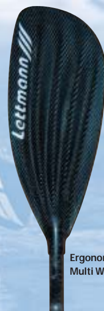
Ergonom Multi Wave Tour